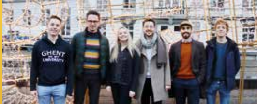
Jong N-VA Gent kiest nieuw bestuur (p. 2)