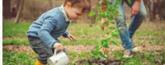
Cadeaubomen voor Gentenaars (p. 3)