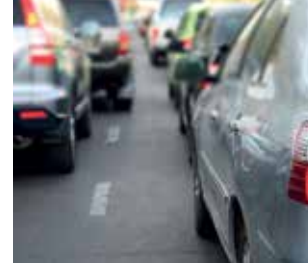
Het circulatieplan doorgelicht p. 2 - 3