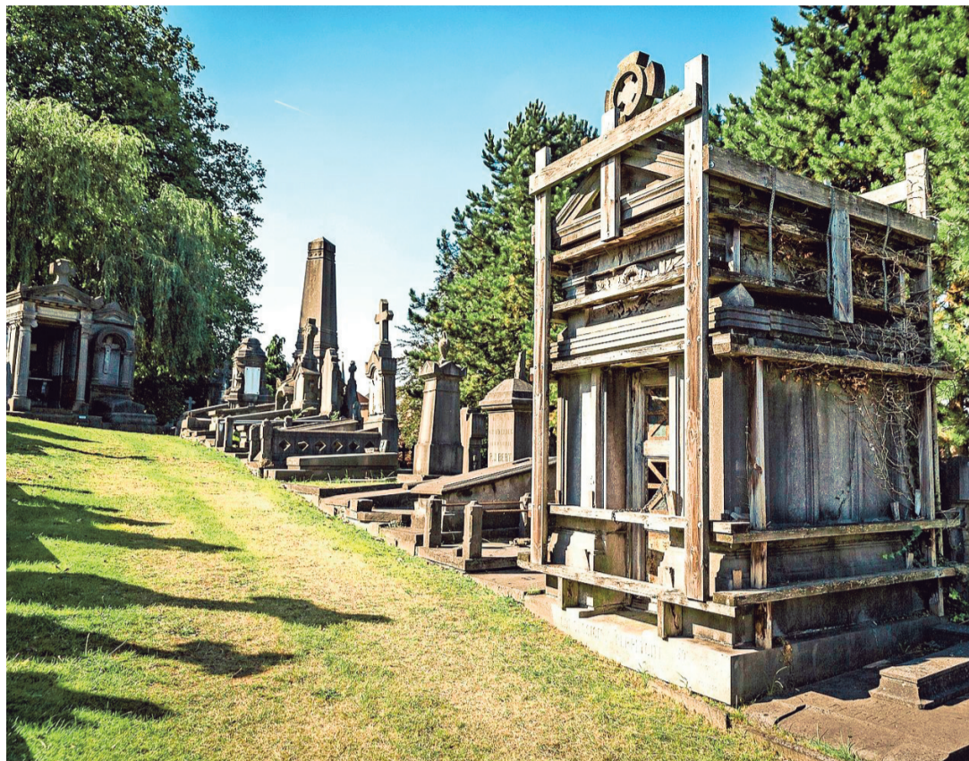
De grafheuvel zelf is nog perfect stabiel, waardoor er geen grondwerken nodig zijn.

De oudste en mooiste begraafplaats van de stad, Campo Santo in Sint-Amandsberg, wordt opgeknapt. Op de grafheuvel zelf werden 149 graven geselecteerd die worden gerestaureerd. Dat zal 700.000 euro kosten. Goed nieuws is dat de grafheuvel zelf nog perfect stabiel is, en dat er dus geen grondwerken nodig zijn.